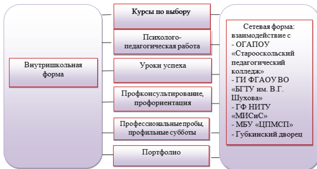
рис. 1 Модель предпрофильной подготовки МАОУ «СОШ №2 с УИОП»