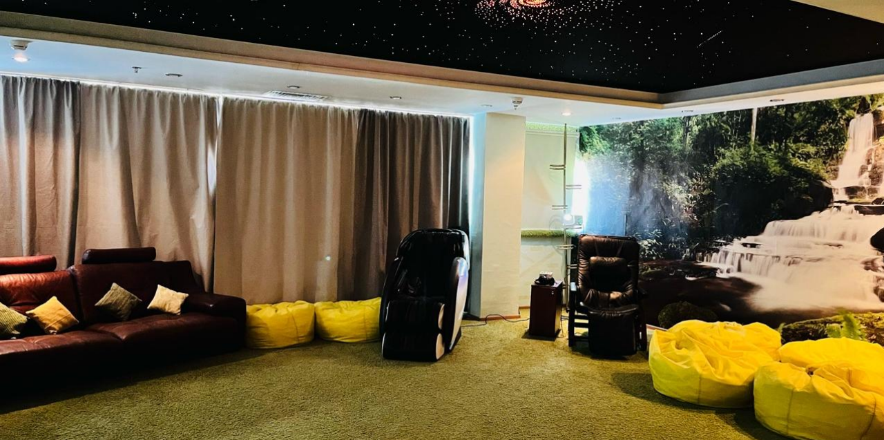
Академии ГПС МЧС России