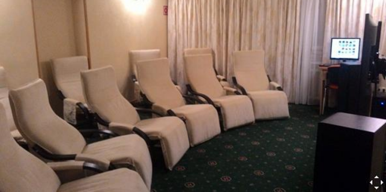
Приволжский ИПК ФНС России