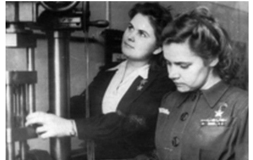
Герои Советского Союза Екатерина Рябова и Антонина Зубкова на занятиях в МГУ