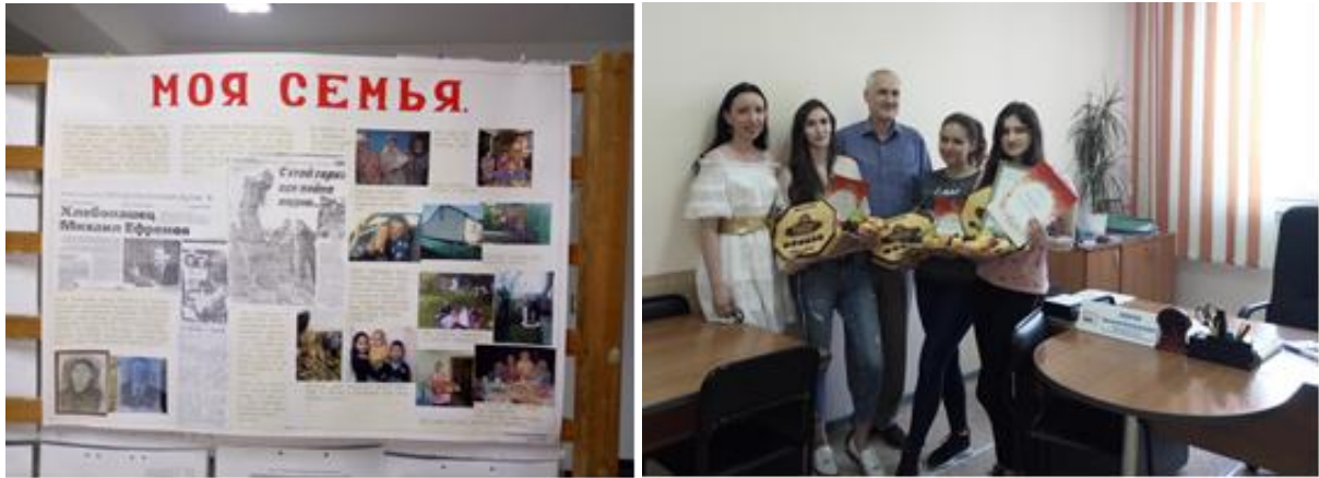
Рис. 1 – Награждение победителей первого конкурса ЭФ «Моя большая семья – хранительница традиций» (2019 год)

Конкурс проводится в следующих номинациях: презентация; видео; семейный альбом; стенгазета.