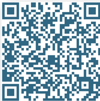
Рис. 2 – Демонстрационный фильм о творческих находках детского сада по просветительской работе с родителями

В практике Службы «Территория мудрых родителей» образовательный ежедневник «Рецепты семейного образования и воспитания» стал особым графическим консультационным пространством, предлагающим очень простые пошаговые рекомендации по моделированию игр-занятий с детьми раннего возраста и ненавязчивых образовательных и воспитательных ситуаций.