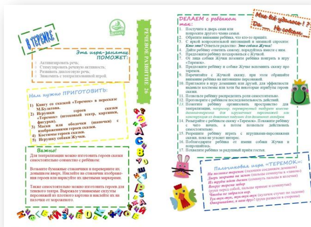
Рис. 1 – Макет карточки из комплекта «Речевое развитие»