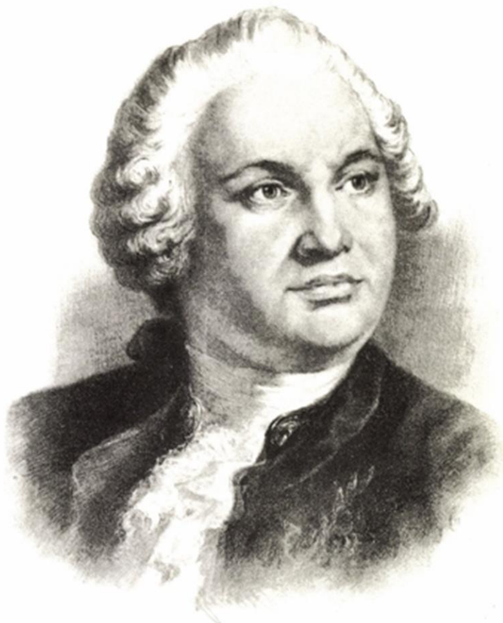
Михаил Васильевич ЛОМОНОСОВ (1711—1765)

Российская система аттестации начинала складываться на базе опыта, накопленного университетами Европы с 1724 года.